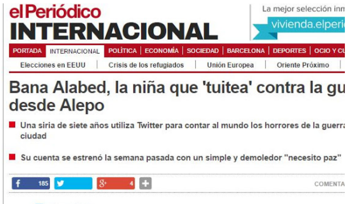
Cabecera del artículo de Javier Triana en El Periódico, una copia del publicado en The Telegraph un día antes.

También en España ha empezado a circular muy pronto. El primero fue El Periódico , justo al día siguiente de que apareciese en The Telegraph: